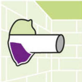
Voor het vullen van leidingdoorvoeren.